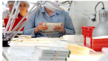
Conditionnement, sous-traitance industrielle