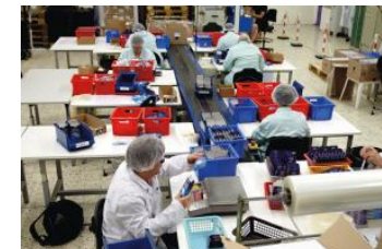
Prestations en entreprise

C'est au travers de la pratique des métiers, que les travailleurs vont acquérir des savoir-faire et de l'autonomie possible pour l'emploi.